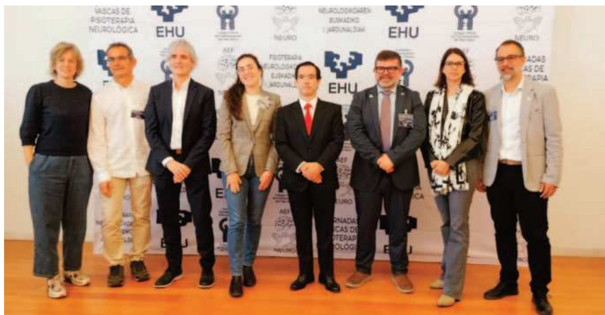
I Jornadas Vascas de Fisioterapia Neurológica

La participación del Colegio Profesional de Fisioterapeutas de Extremadura en este encuentro refleja el compromiso de la entidad con la formación continua, el impulso del conocimiento científico y la presencia activa en los principales foros nacionales de la profesión. ■