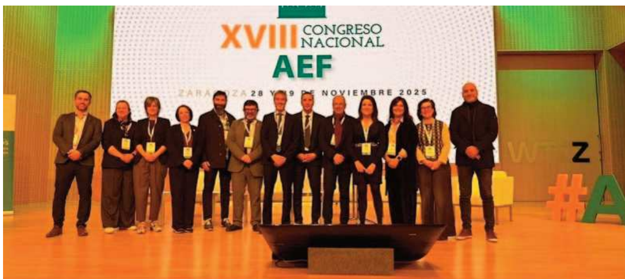
XVIII Congreso Nacional de la Asociación Española de Fisioterapeutas

El Congreso reafirma la AEF como motor de la Fisioterapia nacional, impulsando la actualización científica, la excelencia profesional y la colaboración entre colegios y profesionales de todo el país. □