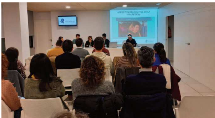
Acto Conmemorativo del Día Mundial de la Fisioterapia 2024.

En cuanto a aspectos profesionales relevantes, se explicó la incorporación de 19 nuevas plazas de fi-