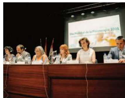
Día Mundial de la Fisioterapia en Llerena

La campaña impulsada por World Physiotherapy este año subraya que el ritmo de envejecimiento mundial avanza a gran velocidad y que la fisioterapia resulta clave para mantener la calidad de vida de las personas mayores. Se recordó