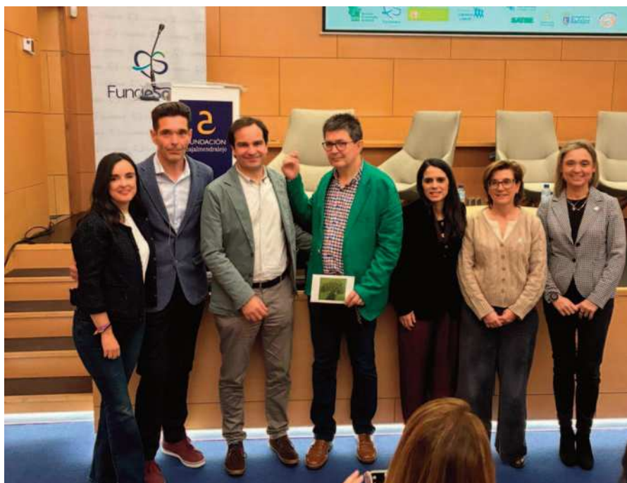
I Jornada de Afrontamiento Activo del Dolor Crónico

La presidenta del Colegio estuvo presente el pasado 4 de noviembre en la celebración del Primer Día del Afrontamiento Activo del Dolor Crónico en Extremadura, una jornada que calificó como un punto de inflexión para la profesión y para la atención a estos pacientes en la región. Durante el encuentro, expresó su reconocimiento a los fisioterapeutas implicados en la organización y desarrollo del evento, destacando su profesionalidad y el compromiso demostrado. Para la presidenta, el éxito de esta iniciativa refleja el camino que debe seguir la Comunidad Autónoma en el abordaje del dolor crónico y supone, además, el inicio de una transformación necesaria para mejorar la calidad de vida de quienes conviven con esta condición. ■