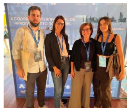
II Congreso Internacional de Afrontamiento Activo del Dolor Crónico en Valladolid

Desde el COFEXT se valora muy positivamente este tipo de encuentros, que