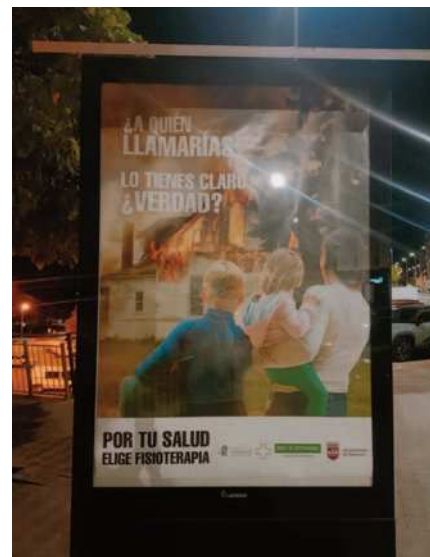
Campaña Intrusismo 2025

Con esta iniciativa, el Colegio refuerza su compromiso con la seguridad de los pacientes y recuerda que el intrusismo no solo supone una vulneración profesional, sino un riesgo directo para la salud. Los vídeos, materiales gráficos y contenidos informativos que acompañan la campaña buscan seguir concienciando a la