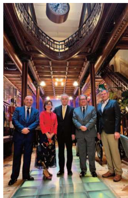
Presentación de la Universidad UNINDE

Con este acercamiento institucional, el Colegio Profesional de Fisioterapeutas de Extremadura reafirma su compromiso con la excelencia académica, el creci-